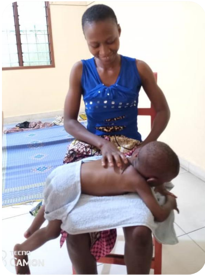
Atelier de massage