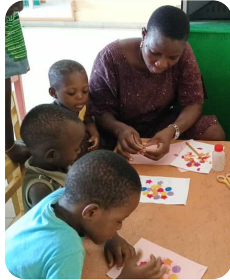
Activité de coloriage