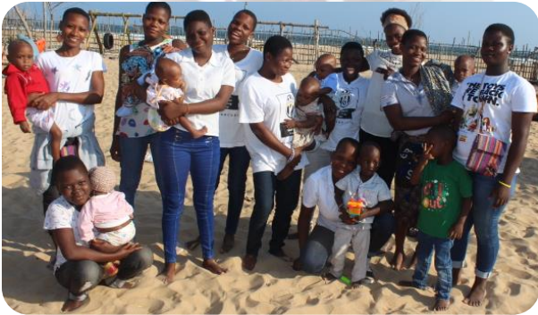
Photo de famille des mères adolescentes